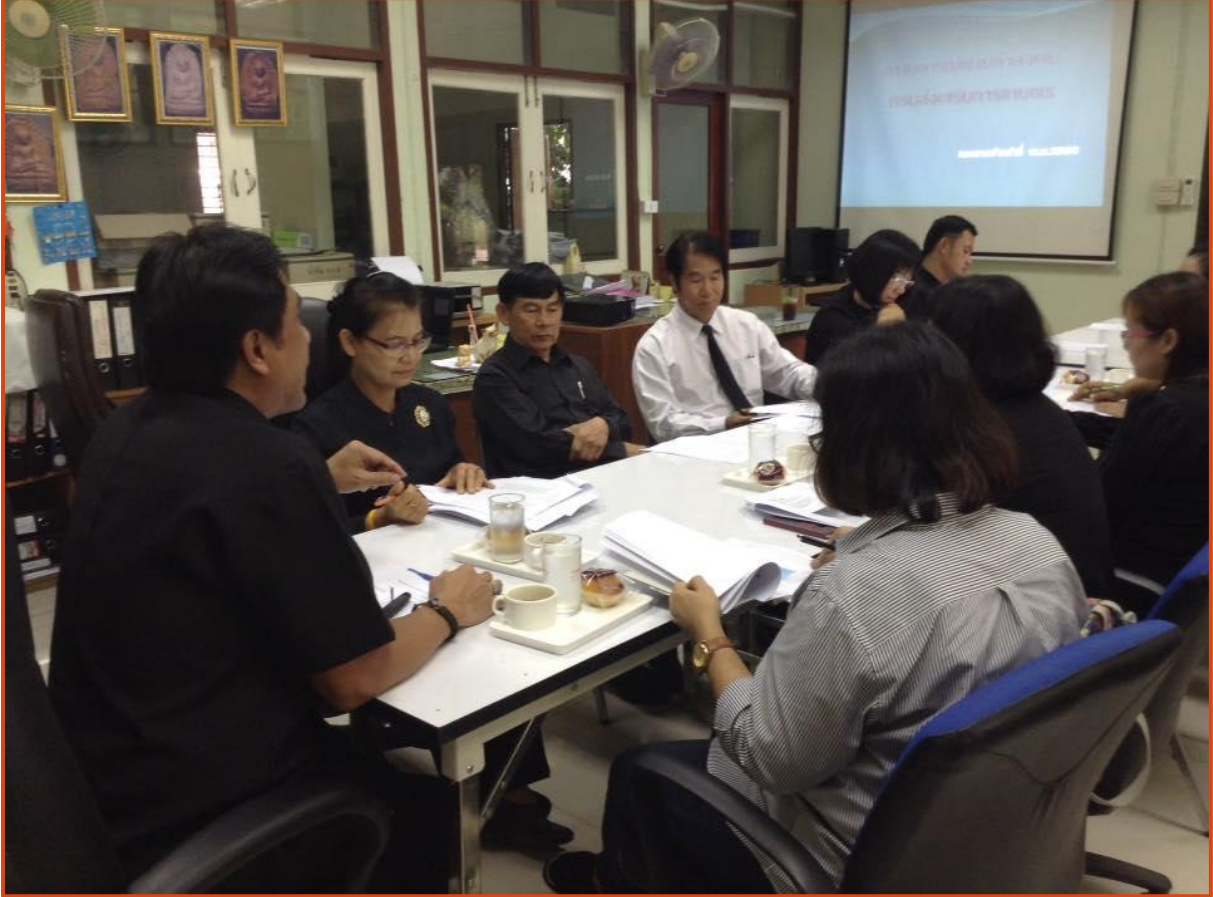
ผู้อำนวยการกองเจ้าหน้าที่ พร้อมคณะ: ร่วมรับฟังข้อดีข้อเสีย ปัญหาอุปสรรค และแนวทางการแก้ไขปัญหา เพื่อรองรับการเปลี่ยนแปลงโครงสร้างราชการที่ทยอยเปลี่ยนไปตั้งแต่วันที่ 5 ปีงบประมาณ/60