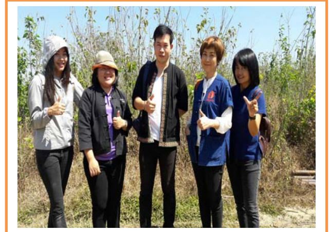
ตรวจติดตามงาน โครงการฯ งบพัฒนาจังหวัด