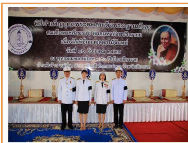
ร่วมงานรัฐพิธี

ปฏิบัติงานตามกฎระเบียบของสังคม และประพฤติปฏิบัติตามหลักธรรมคำสอน มีความตั้งใจที่จะทำงานในหน้าที่ให้ได้รับความสำเร็จด้วยการบริหารจัดการทรัพยากรที่มีอยู่อย่างจำกัดให้เกิดประสิทธิภาพสูงสุด มีความอดทนไม่ย่อท้อต่อปัญหาอุปสรรค มีความรับผิดชอบต่อนตนเอง ครอบครัว และผู้อื่นอย่างจริงจัง ประหยัดอดออม รักษาระเบียบวินัยและเคารพกฎหมาย มีความจงรักภักดีต่อชาติ ศาสนาและพระมหากษัตริย์