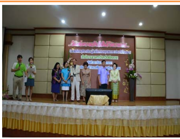
เป็นพิธีกรในงานแสดงมุกตลก

ปฏิบัติงานตามกฎระเบียบของทางราชการ มีความรับผิดชอบต่อหน้าที่ เป็นผู้ใฝ่ศึกษา ค้นคว้า หาความรู้ที่จำเป็นต้องใช้ในการปฏิบัติงานอยู่เสมอ มีความตั้งใจปฏิบัติงานให้ประสบความสำเร็จ สนใจและเอาใจใส่ในงาน มีความรู้ความสามารถและความพึงพอใจในการปฏิบัติงาน ตามระเบียบ กฎ ข้อบังคับ มติ กฎหมายและนโยบายที่กำหนด