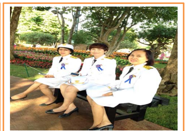
ร่วมรับเสด็จ