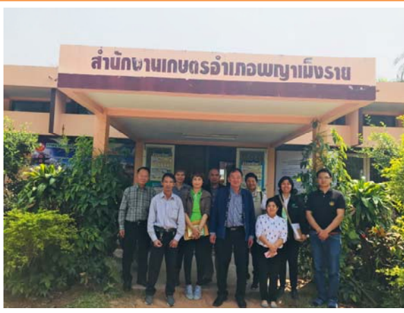
ตรวจติดตามนิเทศ สนง.กษอ.พญาเมืองราย

ปฏิบัติตนเป็นแบบอย่างอันดีกับผู้บังคับบัญชา เพื่อนร่วมงาน ผู้ใต้บังคับบัญชา และผู้มาติดต่องาน เป็นผู้ที่มีมนุษยสัมพันธ์ดี ยอมรับฟังความคิดเห็นของผู้อื่น กล้าและรับผิดชอบในสิ่งที่ได้กระทำมีน้ำใจ ช่วยเหลือ และให้ความร่วมมือในการปฏิบัติงาน ซึ่งเห็นได้จากการได้รับความไว้วางใจจากผู้ว่าราชการจังหวัด ให้เป็นประธานคณะกรรมการในหลายๆคณะ และหัวหน้าส่วนราชการอื่นได้กล่าวถึงในทางที่ดีอยู่เสมอๆ