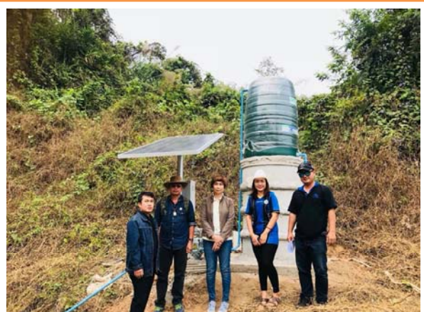
ตรวจรับพัสดुरบบน้ำอำเภอแม่จัน