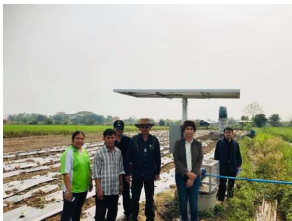
ตรวจรับพัสดुरบบน้ำอำเภอแม่สาย