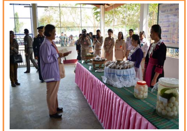
ร่วมรับเสด็จ ณ โรงเรียน ดชด.ชนดัดปียะอู อ.เวียงแก่น