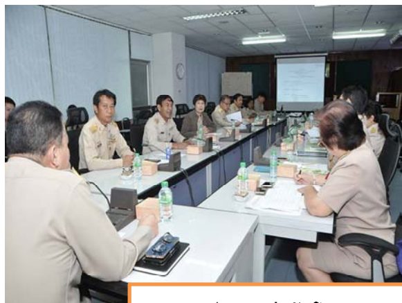
ประชุมเร่งรัด โครงการการก่อสร้างตลาดเกษตรกร

“การทำงานให้สำเร็จไม่ใช่เรื่องยาก แต่การแก้ไขปัญหาในระหว่างการทำงานคือสิ่งที่ท้าทาย”