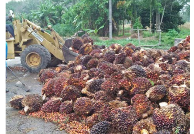
ภาพแสดง...การดำเนินการรวบรวมผลผลิตปาล์มน้ำมันของแปลงใหญ่ปาล์มน้ำมันราชกรูด หมู่ที่ ๗ ตำบลราชกรูด อำเภอเมืองจังหวัดระนอง โดยการทำสัญญาขายกับบริษัทในจังหวัดชุมพร