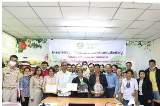
ภาพแสดง...การประกวดแปลงใหญ่ดีเด่น ประจำปี ๒๕๖๓ และการมอบรางวัลเพื่อประกาศเกียรติคุณ