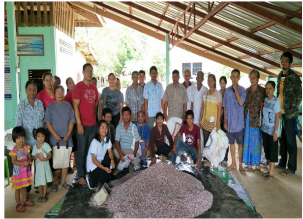
ภาพแสดง..การเป็นวิทยากรจัดกระบวนการแลกเปลี่ยนเรียนรู้การจัดการทุเรียน ระยะติดผล และฝึกปฏิบัติการผสมปุ๋ยใช้เอง