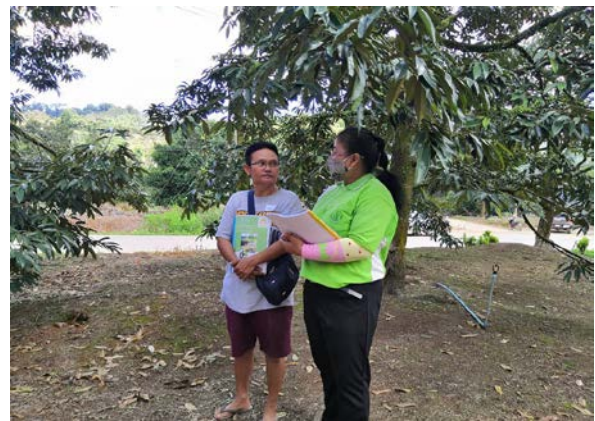
ภาพแสดง...การลงพื้นที่ตรวจสอบและให้การรับรองเพื่อขออนุญาตใช้ตราสัญลักษณ์ สิ่งบ่งชี้ทางภูมิศาสตร์ (Geographical Indications หรือ GI)