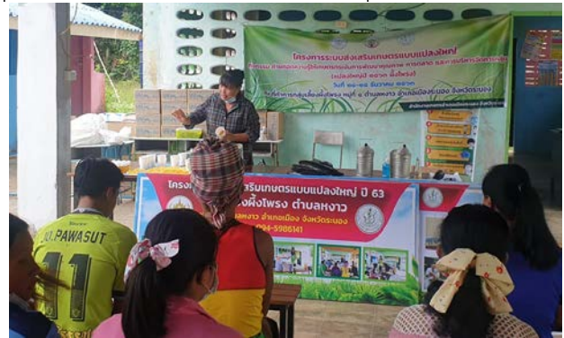
ภาพแสดง...การถ่ายทอดความรู้เรื่องการจัดทำบัญชีครัวเรือน และการถ่ายทอดความรู้การพัฒนาคุณภาพ