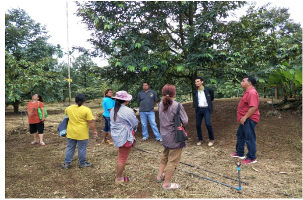
ภาพแสดง...การนำเกษตรกรศึกษาดูงานแปลงเรียนรู้เพิ่มประสิทธิภาพการผลิตทุเรียน (แปลงใหญ่ทุเรียน) และแปลงเรียนรู้การผลิตทุเรียนนอกฤดู