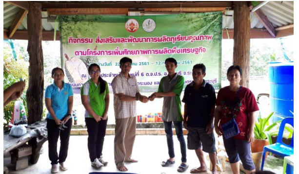
ภาพแสดง...การเป็นวิทยากรจัดกระบวนการแลกเปลี่ยนเรียนรู้การจัดการทุเรียน ระยะออกดอก และฝึกปฏิบัติการผลิตจุลินทรีย์สังเคราะห์แสง