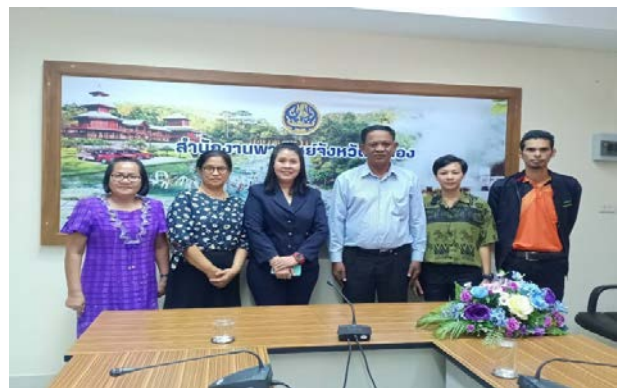
ภาพแสดง...การประชุมคณะทำงานขับเคลื่อนสินค้าสิ่งบ่งชี้ทางภูมิศาสตร์ (Geographical Indications หรือ GI) เพื่อพิจารณาร่างคู่มือปฏิบัติงาน