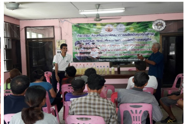
ภาพแสดง...การเป็นวิทยากรจัดกระบวนการแลกเปลี่ยนเรียนรู้การจัดการมังคุด ระยะออกดอก และฝึกปฏิบัติการผลิตจุลินทรีย์สังเคราะห์แสง