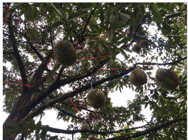
ภาพแสดง...การฝึกปฏิบัติการตัดแต่งผลทุเรียน สำรวจโรคและแมลงในทุเรียนระยะติดผล