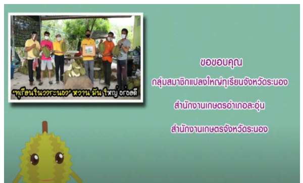
ภาพแสดง...กรมส่งเสริมการเกษตรจัดทำวีดิทัศน์ส่งเสริมการสร้างอัตลักษณ์ไม้ผล ทุเรียนในวาระบอง