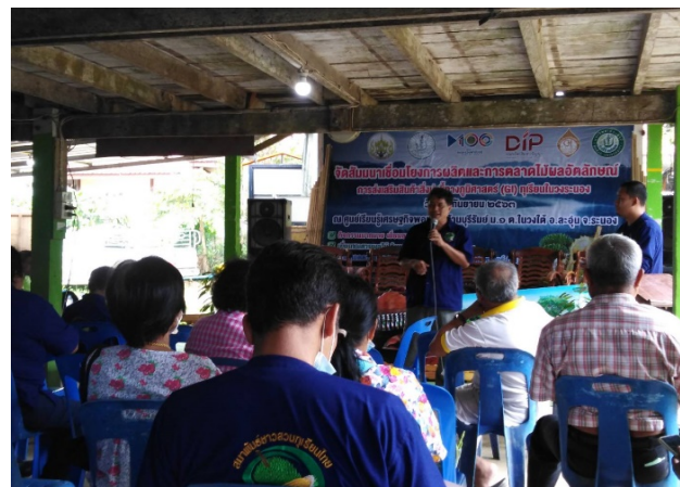
ภาพแสดง...การแข่งขันกินผลไม้ และร่วมแลกเปลี่ยนเรียนรู้วิทยากรโดยอาจารย์จาก ม.แม่โจ้-ชุมพร