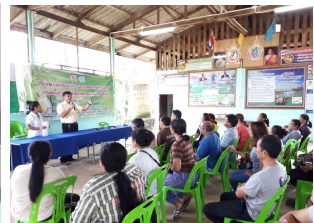
ภาพแสดง..การเป็นวิทยากรจัดกระบวนการแลกเปลี่ยนเรียนรู้การจัดการทุเรียน ระยะติดผล