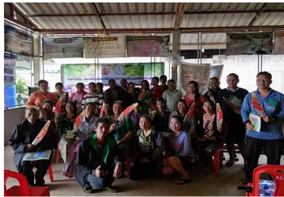
ภาพแสดง...การเป็นวิทยากรจัดกระบวนการแลกเปลี่ยนเรียนรู้การจัดการมังคุด ระยะหลังเก็บเกี่ยว และมอบปัจจัยการผลิต เช่น เลื่อยตัดแต่งกิ่ง เป็นต้น