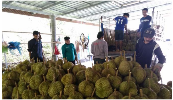
ภาพแสดง...การฝึกปฏิบัติการเก็บเกี่ยวทุเรียน และสำรวจโรคและแมลงในทุเรียนระยะติดผล