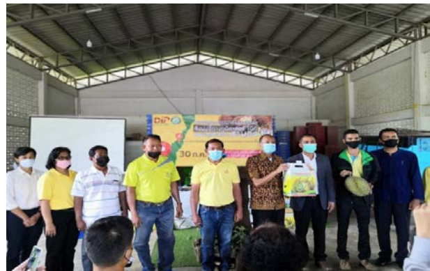
ภาพแสดง...การประชุมชี้แจง และรับสมัครเกษตรกรเพื่อขอการรับรองสิ่งบ่งชี้ทางภูมิศาสตร์ (Geographical Indications หรือ GI)