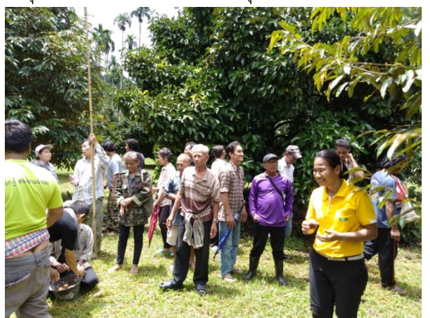
ภาพแสดง...การฝึกปฏิบัติการเก็บเกี่ยวมังคุด และการสำรวจศัตรูมังคุดในระยะเก็บเกี่ยว