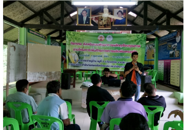
ภาพแสดง...การเป็นวิทยากรจัดกระบวนการแลกเปลี่ยนเรียนรู้การจัดการทุเรียน ระยะเก็บเกี่ยว