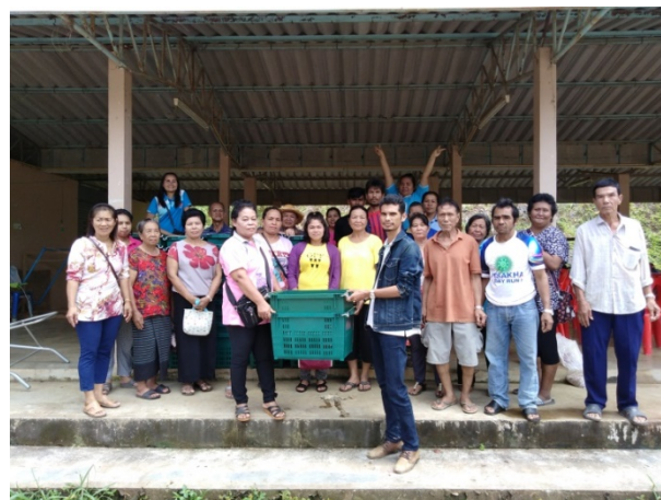
ภาพแสดง...การเป็นวิทยากรจัดกระบวนการแลกเปลี่ยนเรียนรู้การจัดการมังคุด ระยะเก็บเกี่ยว และมอบปัจจัยการผลิต ได้แก่ ตะกร้าผลไม้หูเหล็ก