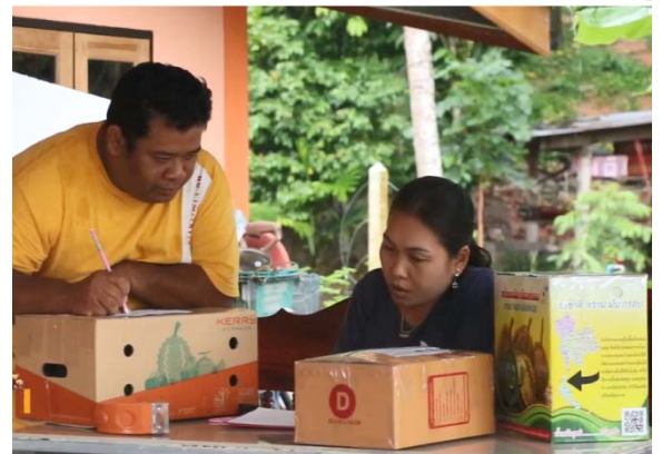
ภาพแสดง...การสนับสนุนช่องทางทุเรียนเพื่อให้เกษตรกรจำหน่ายทุเรียนในวงระนอง ผ่านทางช่องทางออนไลน์ เช่น LAZADA JD Central