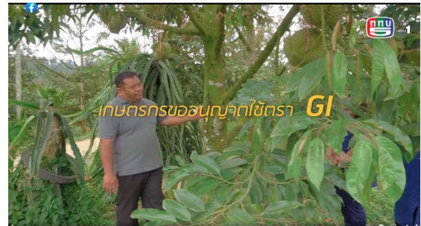
ภาพแสดง...บริษัท สารระดี ศรีเอชเอ็น จำกัด จัดทำวีดิทัศน์ชุด ทุเรียนในวาระบอง ออกอากาศรายการ InnoLife เปิดความคิดสะกิดไอเดียและเผยแพร่ช่องทาง youtube