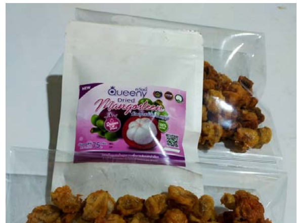
ภาพแสดง...ผลิตภัณฑ์แปรรูปของกลุ่มแปลงใหญ่มังคุด เช่น น้ำมังคุด มังคุดหวาน มังคุดแช่อิ่มอบแห้ง