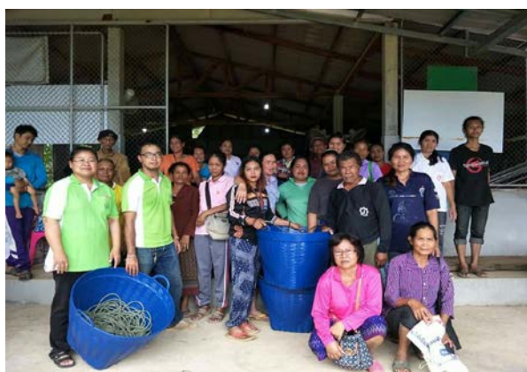
ภาพแสดง...การเป็นวิทยากรจัดกระบวนการแลกเปลี่ยนเรียนรู้การจัดการทุเรียน ระยะเก็บเกี่ยว และมอบปัจจัยการผลิต เช่น ตะกร้า เชือกโยงทุเรียน เป็นต้น