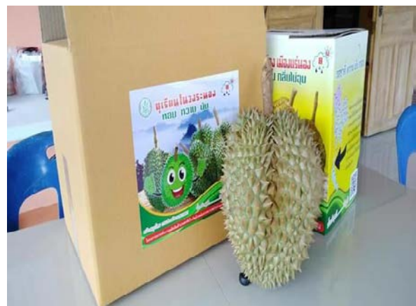
ภาพแสดง...การเป็นวิทยากรกระบวนการแลกเปลี่ยนเรียนรู้เพื่อวิเคราะห์สภาพการผลิต การตลาด การแปรรูป และบรรจุภัณฑ์ พร้อมทั้งสนับสนุนบรรจุภัณฑ์