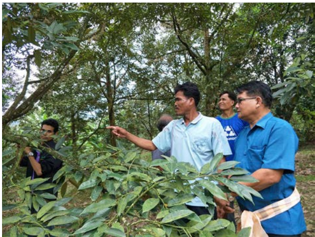
ภาพแสดง...การฝึกปฏิบัติการตัดแต่งดอก สำรวจโรคและแมลงในทุเรียนระยะออกดอก