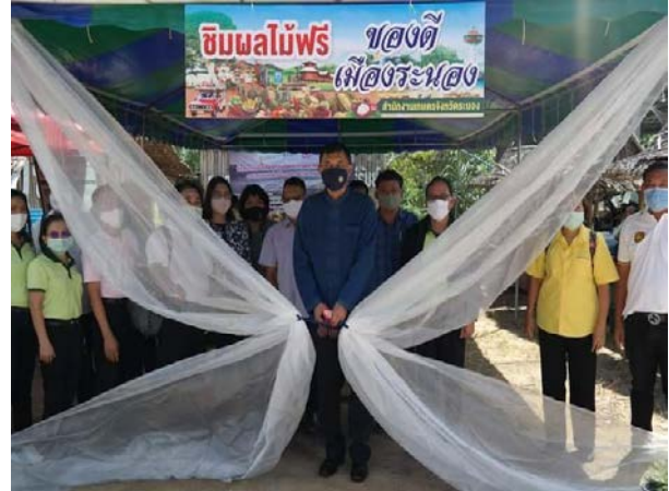
ภาพแสดง...การจัดเวทีเสวนาเชื่อมโยงการผลิตและตลาด และเปิดชิมชิมผลไม้ กิจกรรมกินผลไม้ฟรี