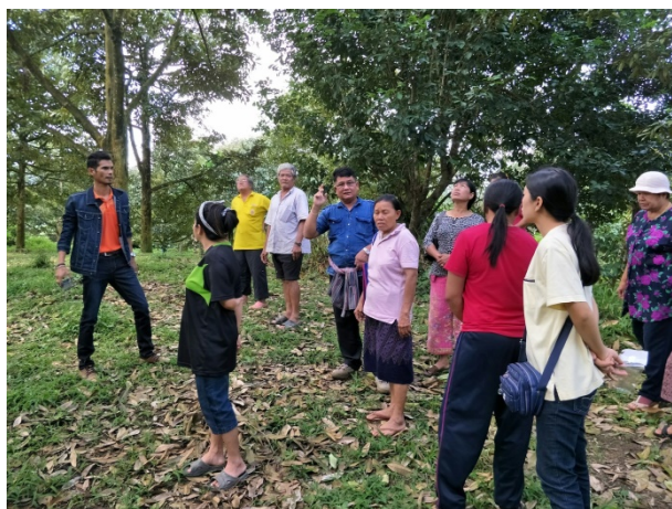
ภาพแสดง...การฝึกปฏิบัติการตัดแต่งกิ่ง สำรวจโรคและแมลงในทุเรียนระยะหลังการเก็บเกี่ยว