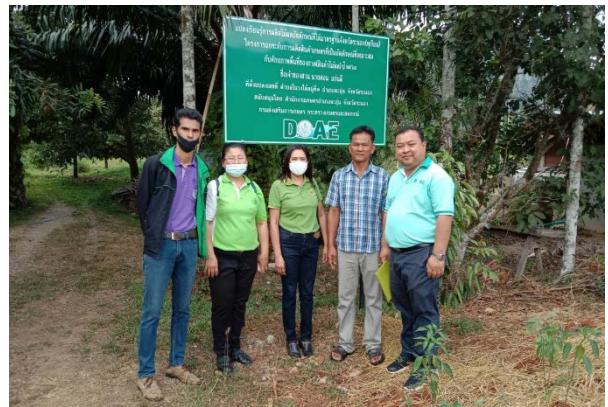
ภาพแสดง...การสนับสนุนวัสดุอุปกรณ์ทางการเกษตร และเยี่ยมชมแปลงเรียนรู้การผลิต ไม้ผลอัตลักษณ์ที่ได้มาตรฐาน