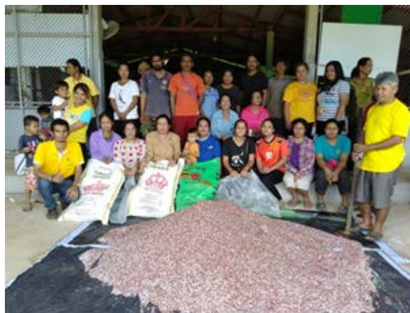
ภาพแสดง...การเป็นวิทยากรจัดกระบวนการแลกเปลี่ยนเรียนรู้การจัดการมังคุด ระยะติดผล และฝึกปฏิบัติการผสมปุ๋ยใช้เอง