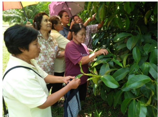
ภาพแสดง...การฝึกปฏิบัติแต่งดอก และการสำรวจศัตรูมังคุด