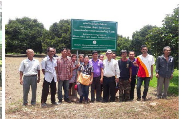
ภาพแสดง...สนับสนุนปัจจัยการผลิต เช่น ปุ๋ยขาว โดโลไมท์ เพื่อใช้เป็นแปลงเรียนรู้เพิ่มประสิทธิภาพการผลิต