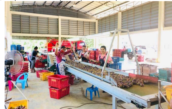
ภาพแสดง...การรวบรวมผลผลิตมังคุดเพื่อการประมูลของกลุ่มแปลงใหญ่มังคุด