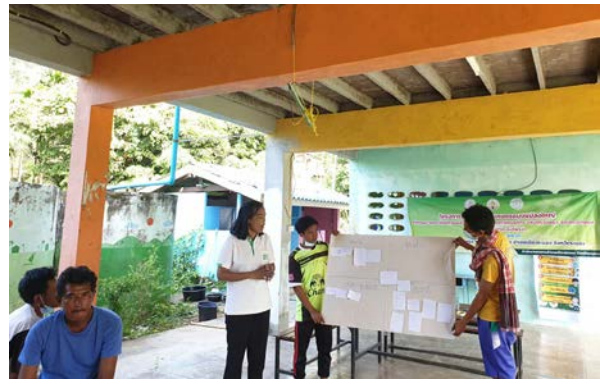
ภาพแสดง...การจัดเวทีวิเคราะห์จัดเก็บข้อมูล และจัดทำแผนการผลิตรายบุคคล และแผนธุรกิจของกลุ่ม