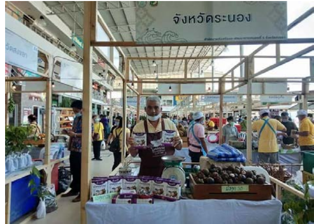
ภาพแสดง...การร่วมงานมหกรรมไม้ผลอัตลักษณ์ และนำสินค้าอัตลักษณ์ไปประชาสัมพันธ์และจำหน่าย