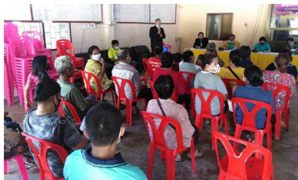
ภาพแสดง...การประชุมบูรณาการขับเคลื่อนโครงการการดำเนินงานของหน่วยงานที่เกี่ยวข้อง และการประชาสัมพันธ์สร้างการรับรู้ให้กับสมาชิกแปลงใหญ่