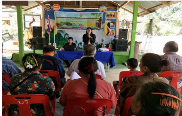
ภาพแสดง...การเป็นวิทยากรถ่ายทอดความรู้เรื่องการผลิต และการทะเบียนสิ่งบ่งชี้ทางภูมิศาสตร์ (Geographical Indications หรือ GI)