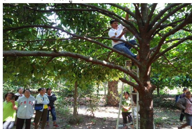
ภาพแสดง...การฝึกปฏิบัติตัดแต่งกิ่งและทรงพุ่มมังคุดปฏิบัติ และการสำรวจศัตรูมังคุด