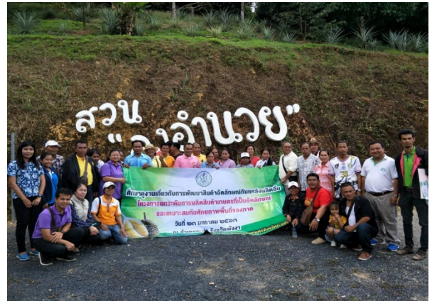
ภาพแสดง...การนำเกษตรกรและเจ้าหน้าที่ ศึกษาดูงานทุเรียนสาธิต GI ณ สวนลุงอำนาจ ม.๓ ต.กะปง อ.กะปง จ.พังงา