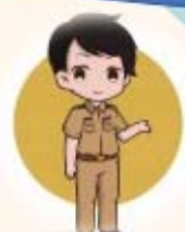
เกษตรกรตำบล