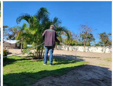
คำอธิบายภาพ...ร่วมทำกิจกรรม ๕ ส ปรับปรุงภูมิทัศน์สำนักงานเกษตรจังหวัดบึงกาฬ