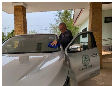
คำอธิบายภาพ... ทำความสะอาดทั้งภายในและภายนอกให้สะอาดเรียบร้อย พร้อมใช้งานในวันต่อไป