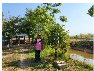
คำอธิบายภาพ...เป็นแบบอย่างในการสร้างรายได้เสริมจากกิจกรรมการเกษตรในครัวเรือน